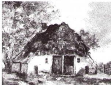
Voor- en achteraanzicht van Dennenboom , in 1960 geschilderd door Albert Michael Jörissen (*Rotterdam 1886, †Zutphen 1971).

Wat dit plaatsje Dennenboom betreft, volgens het bevolkingsregister uit 1830 was de naam van het huis "het Dennenboom voorheen Starink ". De eerste naam houdt vermoedelijk verband met de veldnaam Dennenmaatje 2 , zoals het huis nu genoemd wordt, maar welke Starink hier vernoemd werd is niet bekend 3 .