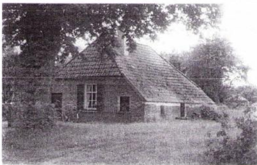
Dennenboom in 1960, vlak voordat het huis werd afgebroken en de familie Tragter er nieuw bouwde.