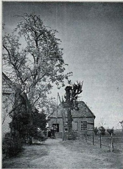
't Oude Weerdshuis.