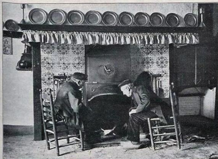
De twee oudjes voor den haard gezeten.

Maar de met boomen aan weerszijden gestoffeerde wegen vormen nog lanen en de streek is nog zeer boschrijk.