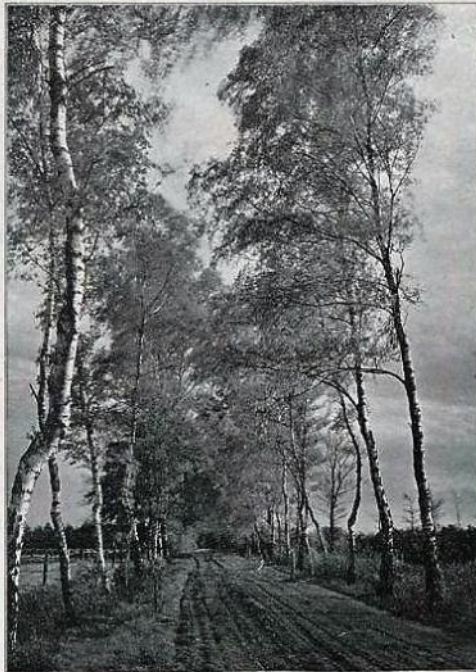
De Berkentaan, die naar 't Bosch van den huize Vorden leidt.

Bruisend vloog de storm door 't kaal geboomte op een afstand. Dikke takken werden er van de knoestige stammen der oude woud-